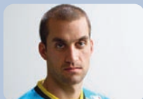
MILLSAPS Davi FL - Honda