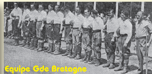
Equipe Gde Bretagne