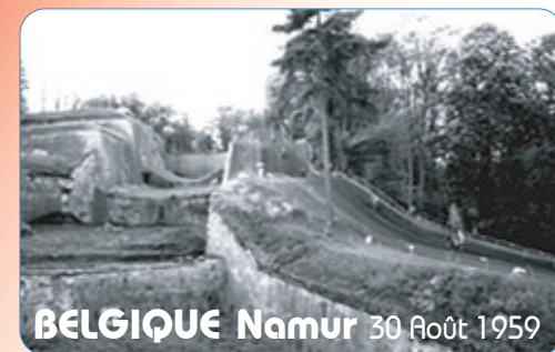
BELGIQUE Namur 30 Août 1959