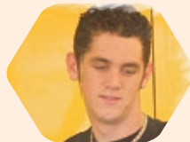
AVIS Wyatt ZA - Suzuki