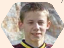
IRT Jernej SI - Kawasaki