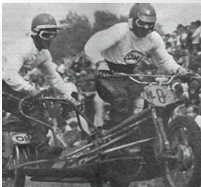
Lubbers - Notten