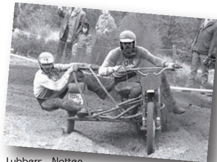
Lubbers - Notten

Passager Néerlandais, Sdx Europe : 1971 / 1975