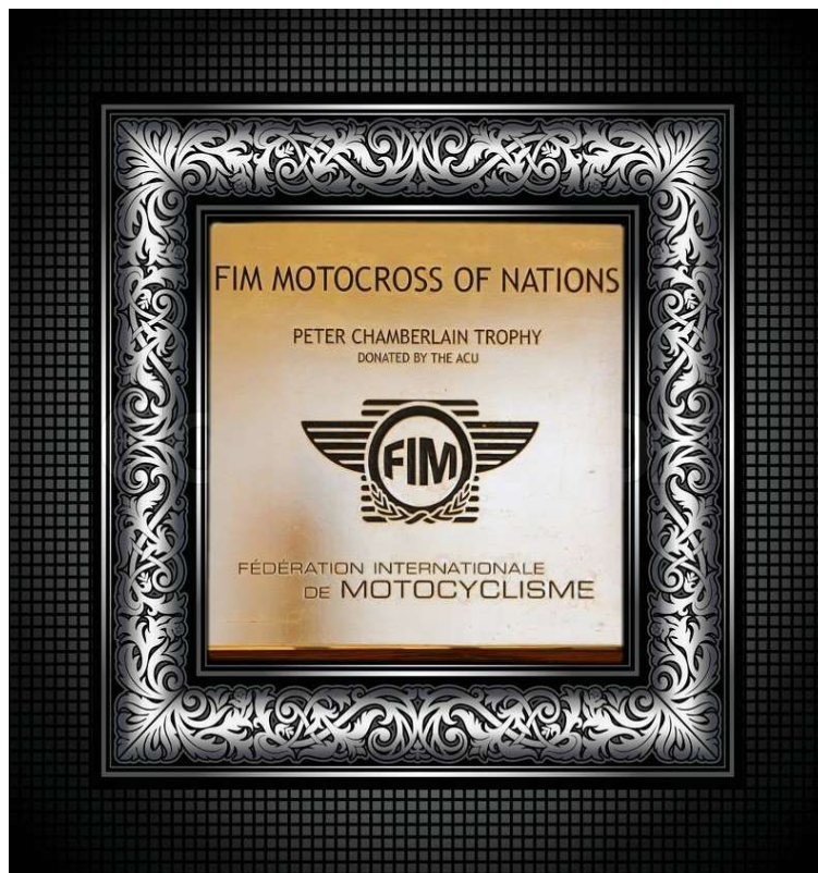
le Motocross des Nations 500cc - 29 août 1954