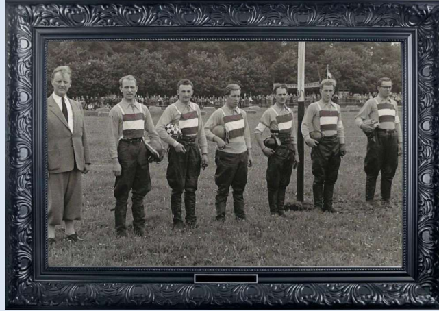
Equipe locale - Hollande