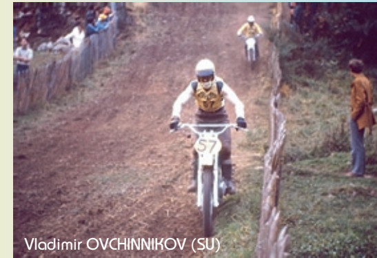
Vladimir OVCHINNIKOV (SU)