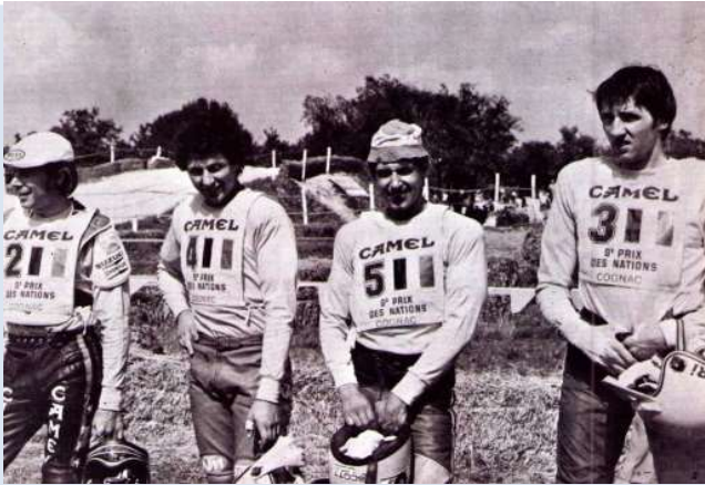
Victoire de la Belgique DeCoster 2, Malherbe 4, Mingels 5, Van Velthoven 3