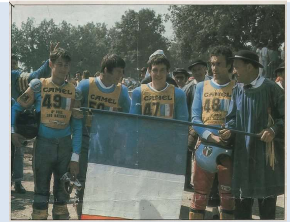
Equipe de France - Meilleure équipe... des qualifications