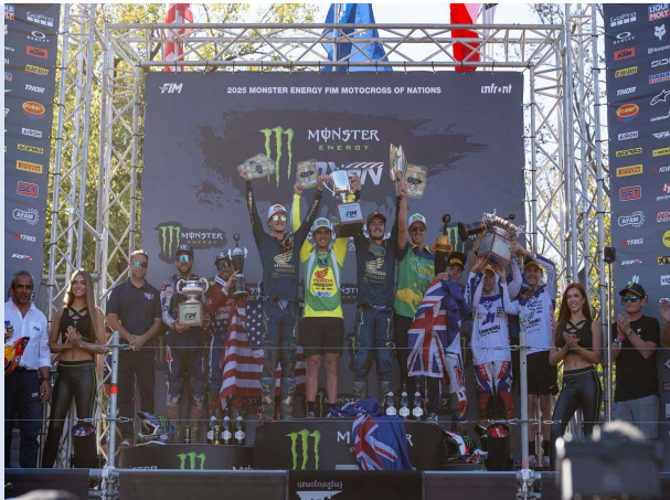
Podium 1 Australie - 2 Etats-Unis - 3 France