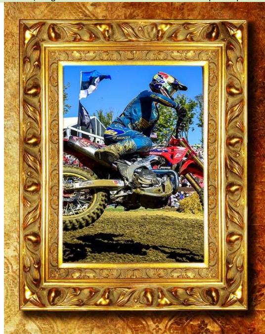
Jett Lawrence Australie Honda MxGP