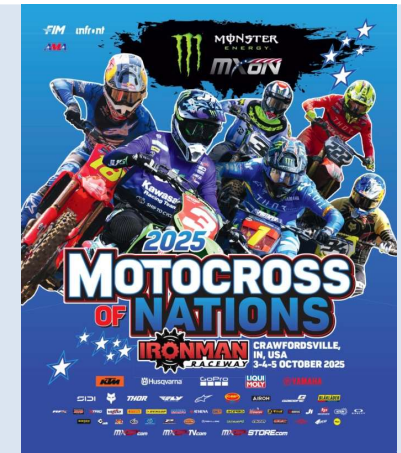
Motocross des Nations 3/4/5 octobre 2025 Ironman - Etats-Unis (Indiana)