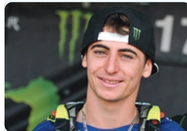
31 è Dylan FERRANDIS

2014 3 è Mx2 1GP : BR 2015 1 è MxGP 8GP : Villars s E - IT - DE - SE - CZ - IT - MX - US + 1MxdN (Emée) 2016 4 è MxGP 3GP : TH - NL - St Jean d'Y + 1MxdN (IT) 2017 6 è MxGP <2 è + 1MxdN (GB) 2018 6 è MxGP <2 è 2019 9 è MxGP 1GP : CZ