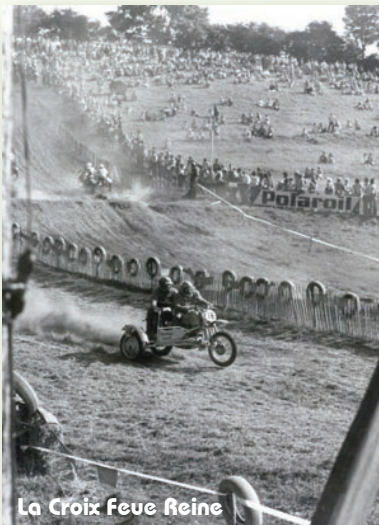
La Croix Feuë Reïne

C'est en 1981 qu'à lieu la transition, quelques centaines de mètres plus loin, vers l'actuel circuit des Rois (photos).